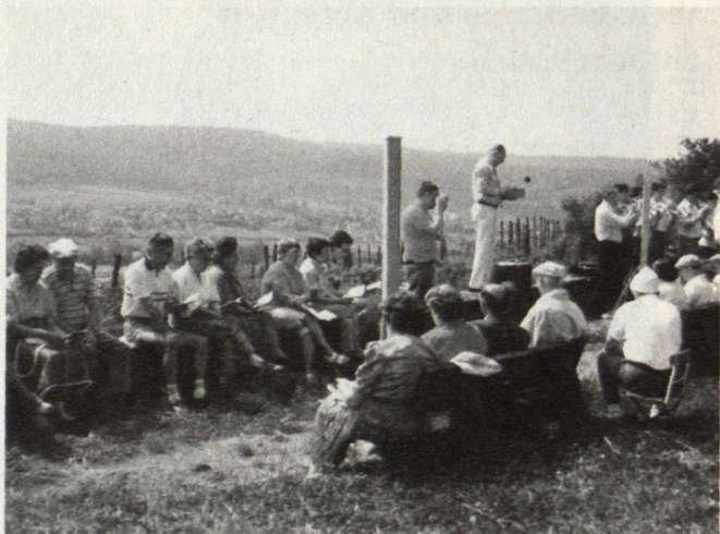
Als Gemeindepfarrer und Dekan im Remstal