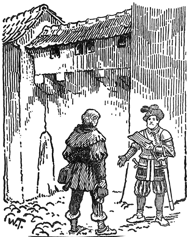
Am Tor wurde er angehalten und nach seinen Papieren gefragt